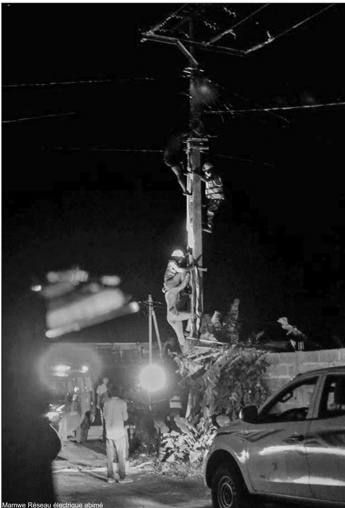
Mamwe Réseau électrique abimé